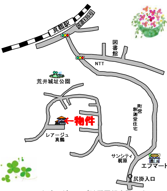
*このハウジングマップは概要紹介図です。